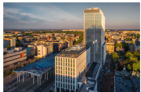
Kompleks HI Piotrowska 155