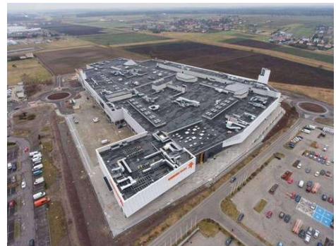
Galeria GEMINI PARK